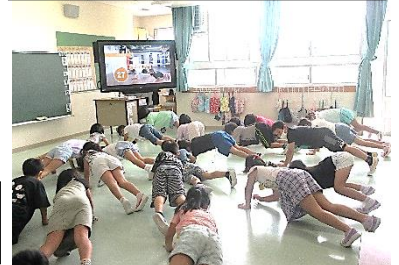
休校中の運動動画を体験中！ タブレットを使います。

休校中のお知らせは、学校ホームページで随時、発信します。急な変更等はメルポんでもお知らせしますので、まだ登録していない方は、登録をお願いします。登録方法やQRコードは、学校ホームページにもあります。