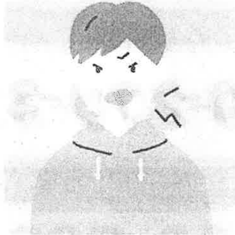
怒りやすくなった