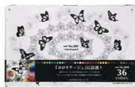
副賞の三菱鉛筆色鉛筆 No.888<36色セット>