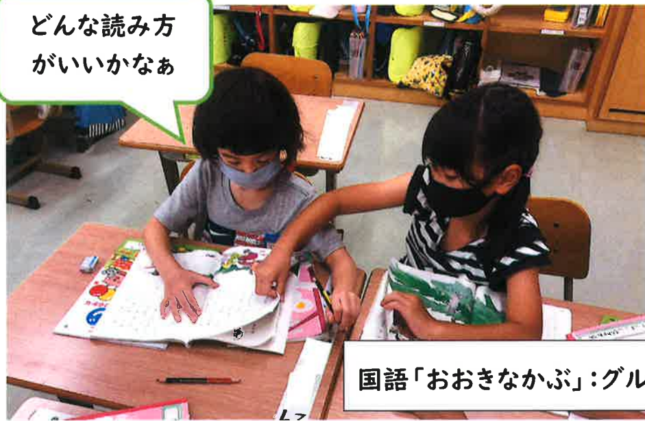
どんな読み方が いいかなあ