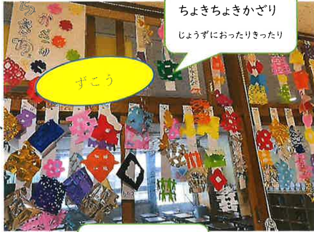
ちよきちよきかざり じょうずにおったりきったり