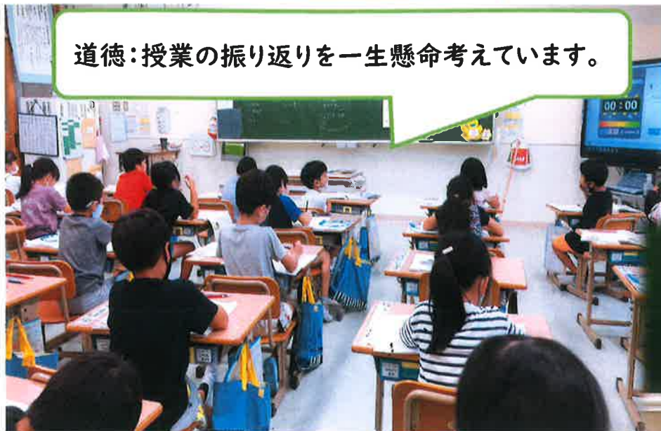
道徳:授業の振り返りを一生懸命考えています。