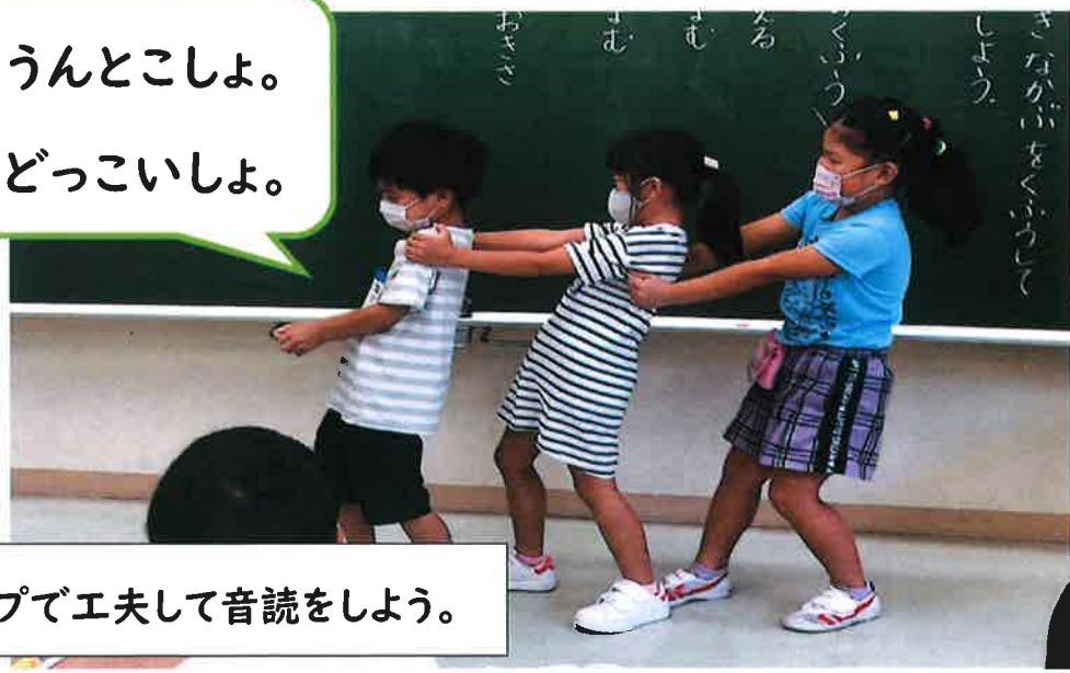
うんとこしょ。 どっこいしょ。