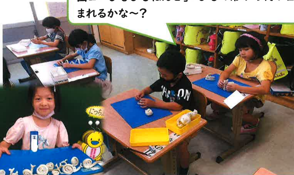
図工「ひもひもねんど」:ひもの形から何が生まれるかな～?