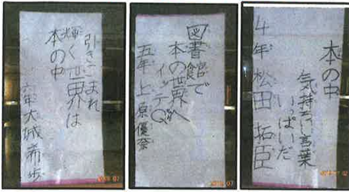
6年 大城 希歩