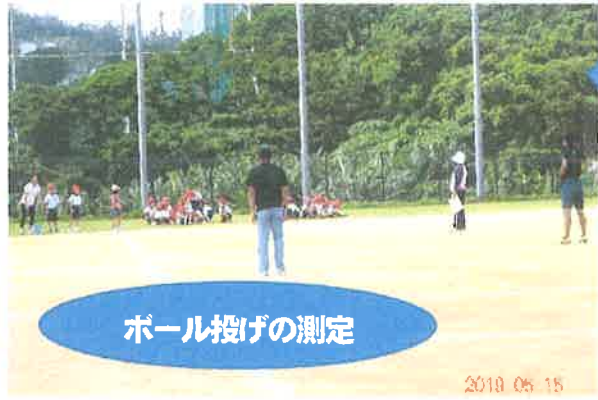
ボール投げの測定