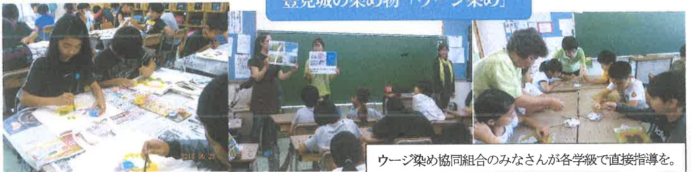
ウージ染め協同組合のみなさんが各学級で直接指導を。