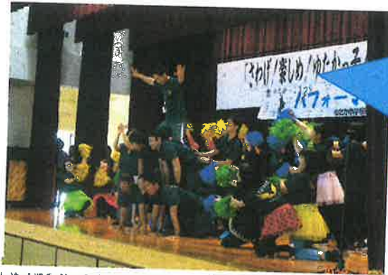
先生方のダンスはごっつったかな？校長先生も練習しましたよ〜 USA