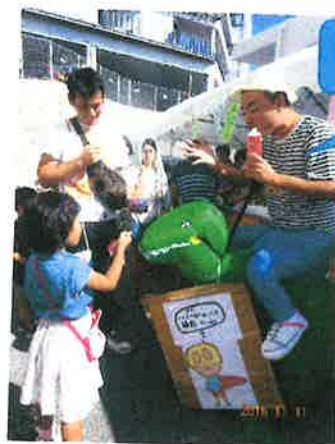
じゃんけんにも勝ったら、ミルクサービス